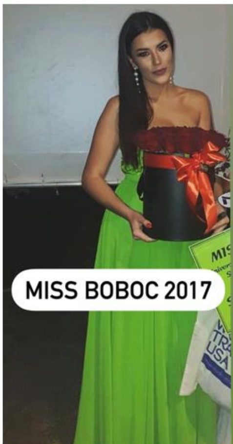
MISS BOBOC 2017