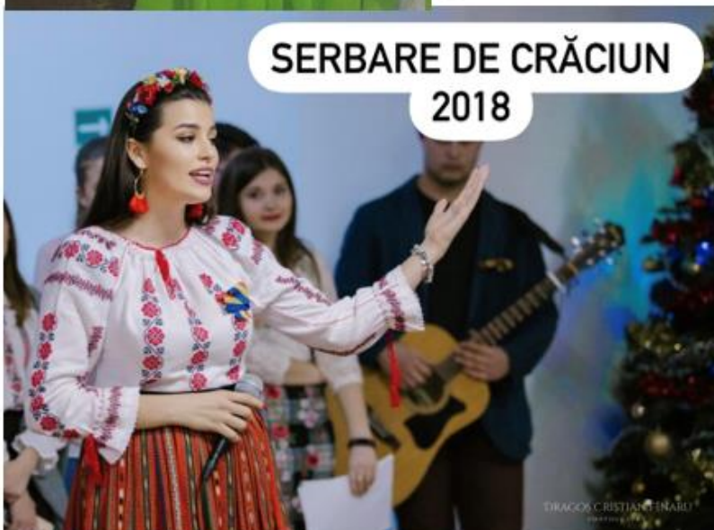
SERBARE DE CRĂCIUN 2018