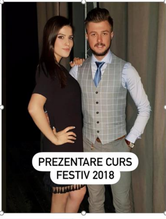
PREZENTARE CURS FESTIV 2018